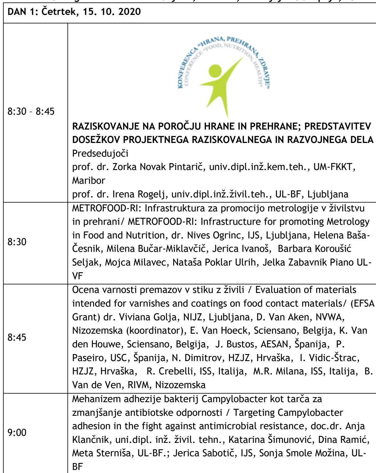
Tabela 10: Program konference »Gojimo, hranimo, ohranjajmo. Skupaj«, 1. dan