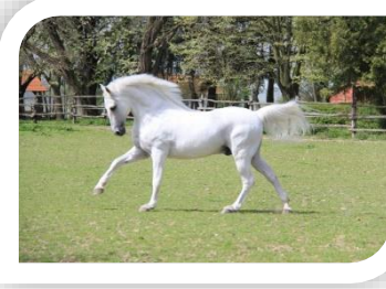
Ergela lipincev Đakovo