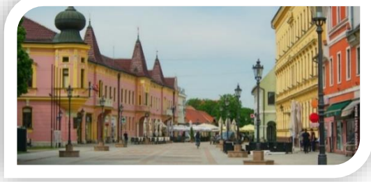
Vinkovci – mestno jedro

Sledi ogled mesta Vinkovci v družbi lokalnega turističnega vodiča – obisk mestnega muzeja - ogled arheološke in etnološke postavitve, pripovedi o antični zgodovini mesta, sprehod po "barokni jezgri" z motivi Orion, ogled cerkve Sv.Euzebija in Poliona, mestne knjižnice, zgodnje romanske cerkve Sv.Ilije na Meraji ter seveda prijeten sprehod po prečudovitem mestnem parku ter cona za pešce, s premnogimi prelepimi lokali in mestnimi gostilnicami.