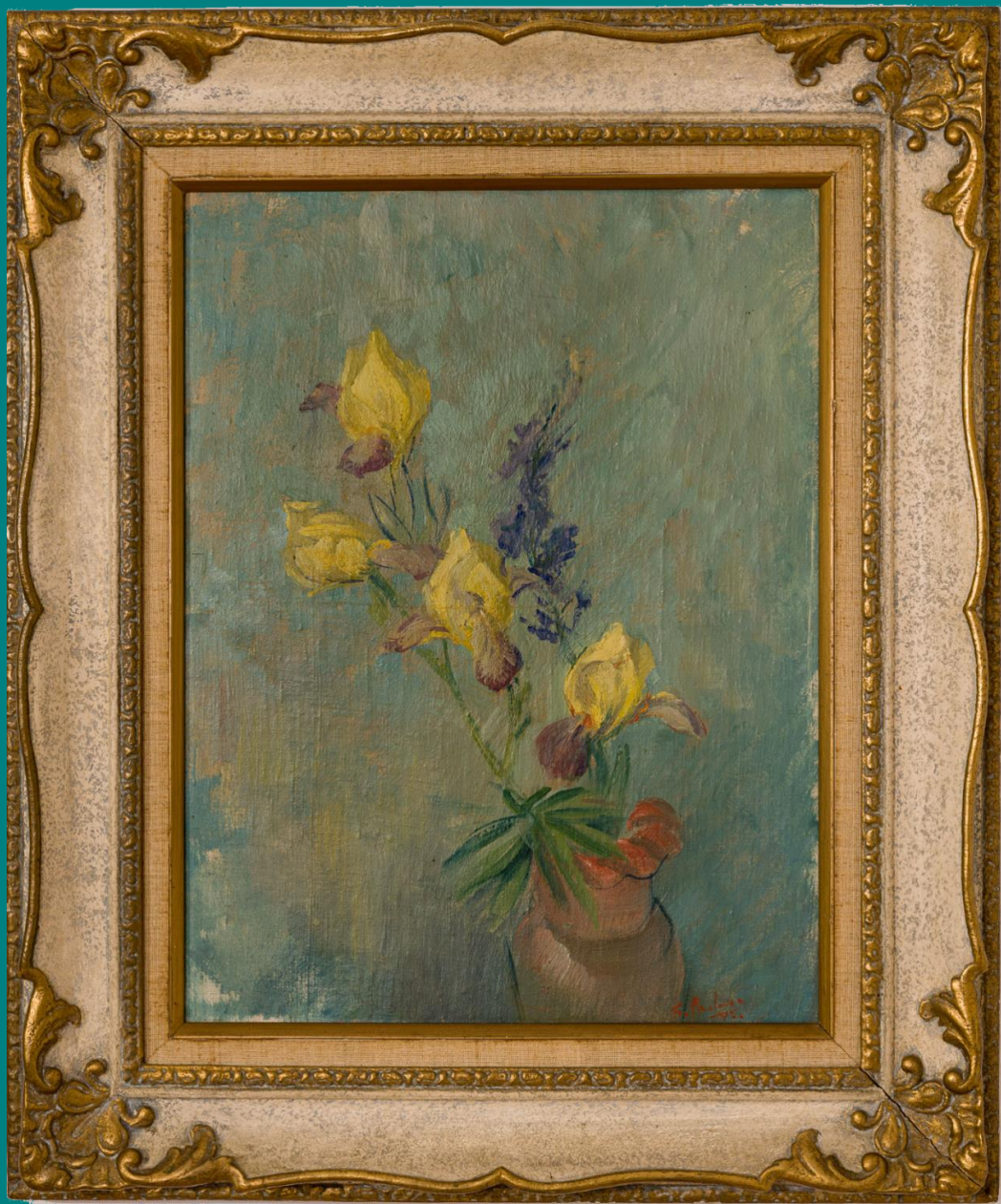
France Pavlovec, Perunike, 1951, olje na platnu, Galerija Kambič