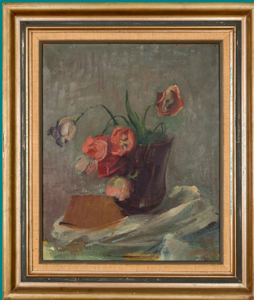
France Pavlovec, Tulipani, 1945, olje na platnu, Galerija Kambič