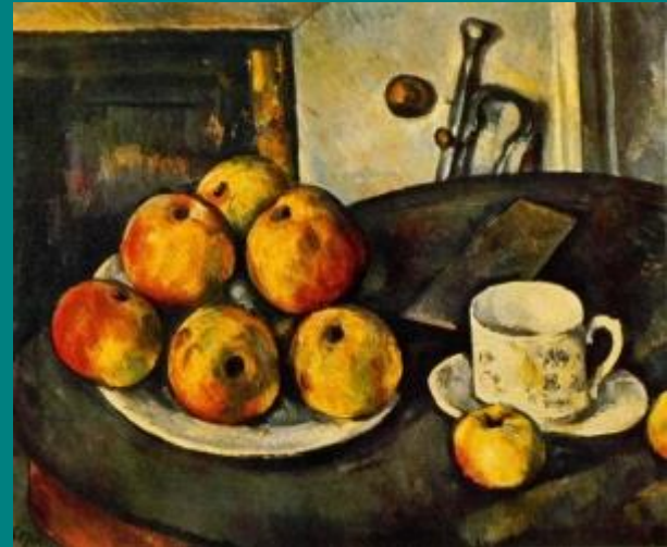
Paul Cézanne, Tihožitje z jabolki, 1890, olje na platnu, Ermitage, Sankt Peterburg