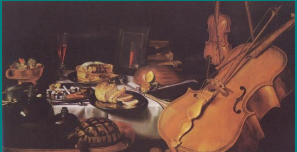
Tihožitje z glasbenimi inštrumenti, Pieter Claeszoon, 1623, olje na platnu, 69 x 127 cm, Pariz, Louvre