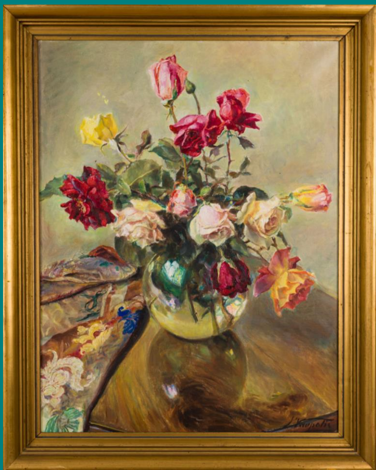
Ivan Vavpotič, Cvetje, olje na platnu, Galerija Kambič