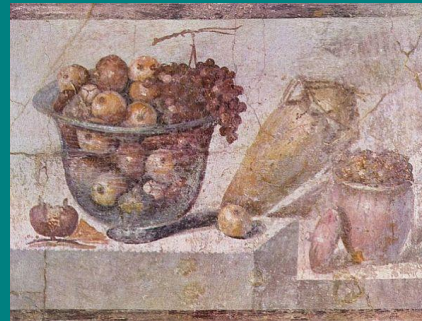
Prosojna skleda s sadjem je naslikana na steni hiše v Pompejih. Freska je nastala okoli leta 70. Stari Rimljani so zelo cenili dekorativno vlogo tihožitja