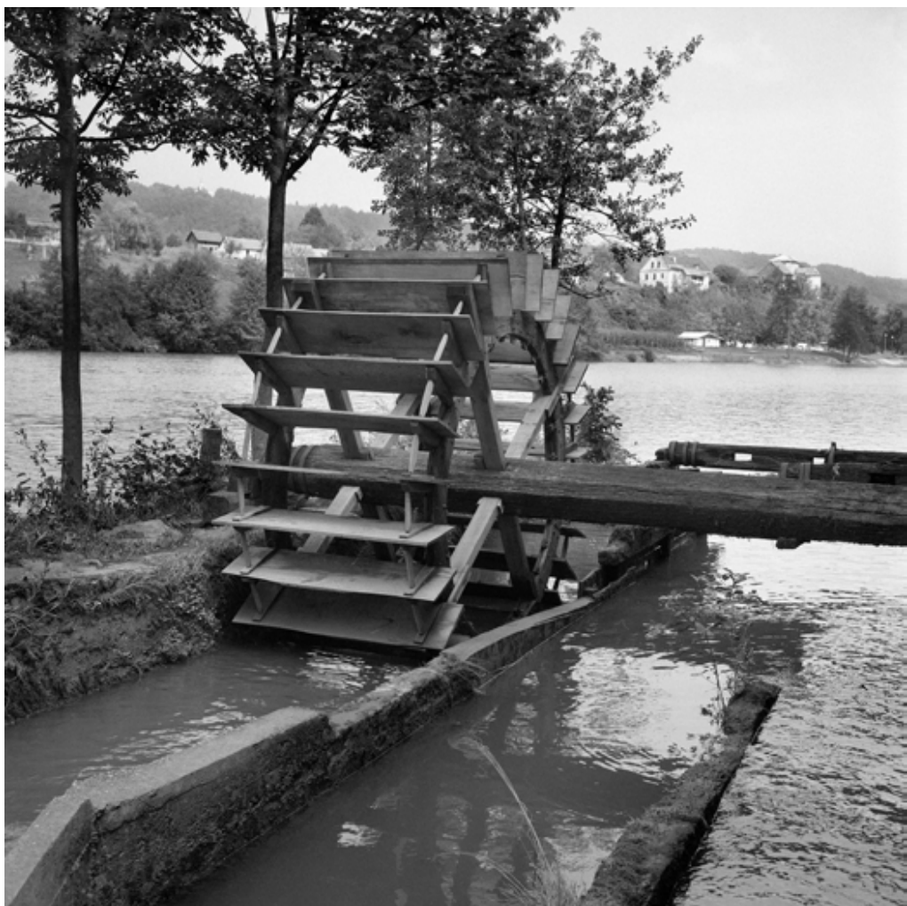
Pogled proti Vinici, 1974