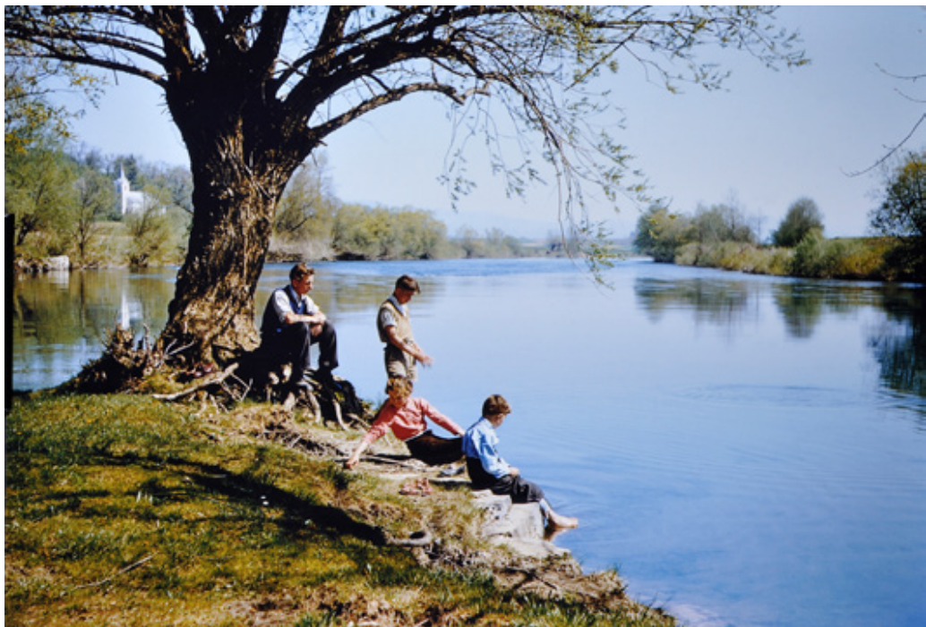
Kolpa pri Podzemlju, 1955

Oče se je začel s fotografijo ukvarjati okoli leta 1954. Prva meni znana serija fotografij je iz Dražgoš. Te fotografije mi je večkrat omenil, enkrat sem celo naredil nekaj povečav. Spomnim se odličnih portretov domačinov in gozdarjev pri delu v snegu v Jelovici. Večkrat je razmišljal o razstavi, katalogu, telefoniral v Dražgoše in spraševal o ljudeh, delal zapiske, potem pa je začel pisati nek drug članek in ideja je vsakič ostala neuresničena. Negativi so zdaj spravljani v eni od številnih škatel v arhivu; upam, da bomo kdaj pripravili tudi to razstavo.